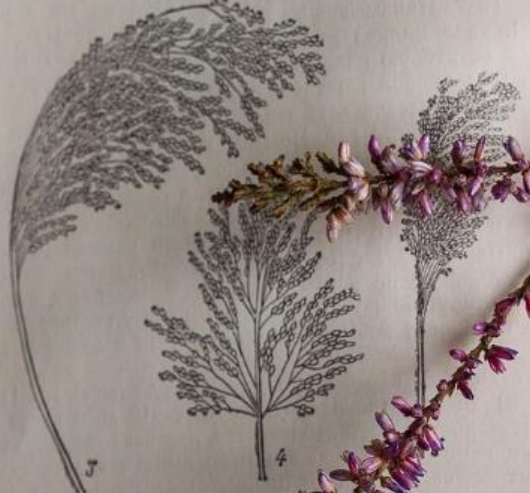
Рис. 17. Метелки проса: 1 — раскидистое; 2 — развесистое; 3 — овалное, или полу- комовое; 4 — овалное, или полукомовое; 5 — комовое.

только у нижних ветвей; 3) сжатое ( contractum Al.) — ось длинная, изогнутая, все боковые ветви прижаты к главному стержню, подушечек нет или они слабо выражены; 4) овалное, или полукомовое ( ovatum Porov). — метелка укороченная, плотная, нижние ветви отклонены, а верхние прижаты к оси, подушечки имеются лишь у нижних ветвей; 5) комовое ( compactum Kõgn) — метелка наиболее короткая, прямая, плотная, с сильно прижатыми к главной оси короткими боковыми ветвями, подушечки отсутствуют (рис. 17).